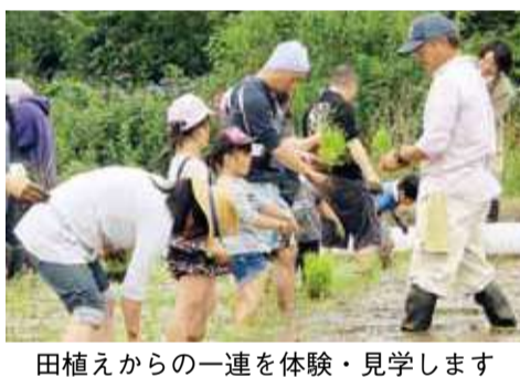
田植えからの一連を体験・見学します