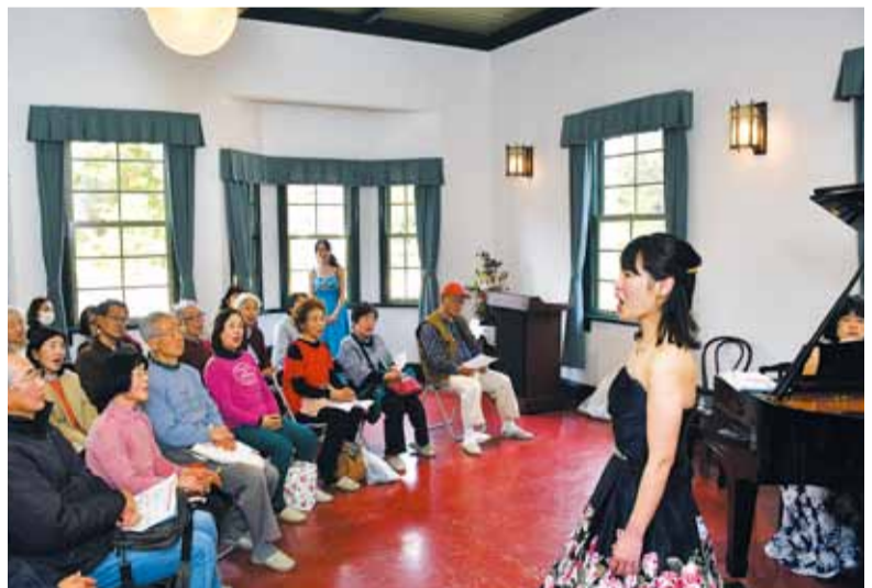
天井の高い洋館は音響効果も抜群。2月の遊館日では、洋館の雰囲気とマッチしたpoco a pocoの演奏が観客を魅了しました

会場の案内や受け付けでもボランティアが活躍（左写真）。市民が支えるイベントに、一度足を運んでみませんか。