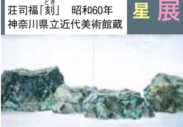
荘司福「刻」 昭和60年 神奈川県立近代美術館蔵

■イイベント名、実施日、参 加者全員の 必要事項 ・年齢を、 はがき・メールで、4月11 日(木)までに、美術館[at- muse@h.]へ。