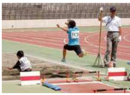
基礎練習や種目別練習などをします

明治学院大学・日本ウエルネススポーツ大学。4月20日(土)・21日(日)、午後1時から。バッティングパレス相石スタジアムひらつか。 総合公園ではツイッターを始めました。イベントや大会の情報、季節の情報などを届けます。アカウント名は「平塚市総合公園」です。 総合公園管理事務所 ☎35-2233