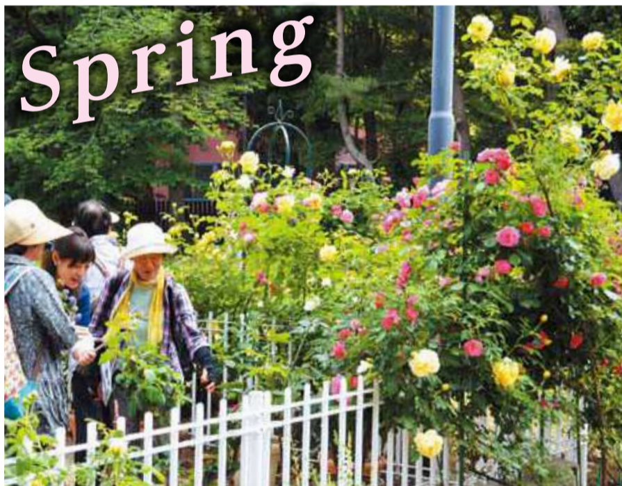
「バラは剪定が重要」と話す庭園スタッフ。1月・2月に枝の先端、3分の1程度を切り落とされたバラ(左写真)は、5月には満開を迎えます(右写真)