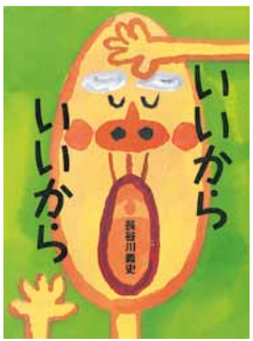
絵本館 平成18年発行 中央・北・西・南図書館所蔵

なとつぴな出来事に対して も「いいからいいから」と答 えるところです。おじい ちゃん以外の登場人物は突 如起きる問題に「どうしよ う!」とドキドキしてしま います。彼らは絵本を読ん でいる私たち自身です。と ころが「おじいちゃん」はど んな困難にも動じません。 そして、想像を超える寛大 な気持ちで相手を受け入 れ、その場を一瞬でほっこ りと温めてしまうのです。 読者は肩の力がスッと抜 けていきます。絵本ですが、 子どもから大人まで、ほっ と一息つける一冊です。 どんなに心や体が丈夫な 人でも環境の変化は多かれ 少なかれストレスになりま す。頑張っているあなた自 身に、たまには「いいから いいから」と声を掛けてみ ませんか。