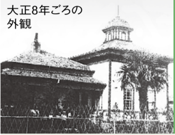
大正8年ごろの外観