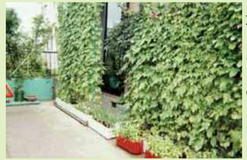
昨年度の個人の部で最優秀賞を取ったみどりのカーテン

■ ①は 必要事項 ・希望時間を、ファクス・メールで、4月5日(金)～5月10日(金)に、②は市ウェブなどにある応募用紙と、裏面に氏名と住所を記載した写真を、郵送・メールまたは直接、9月6日(金)までに、本館5階の 環境政策課 ☎21-9762 ☒kankyo-s-event@へ。